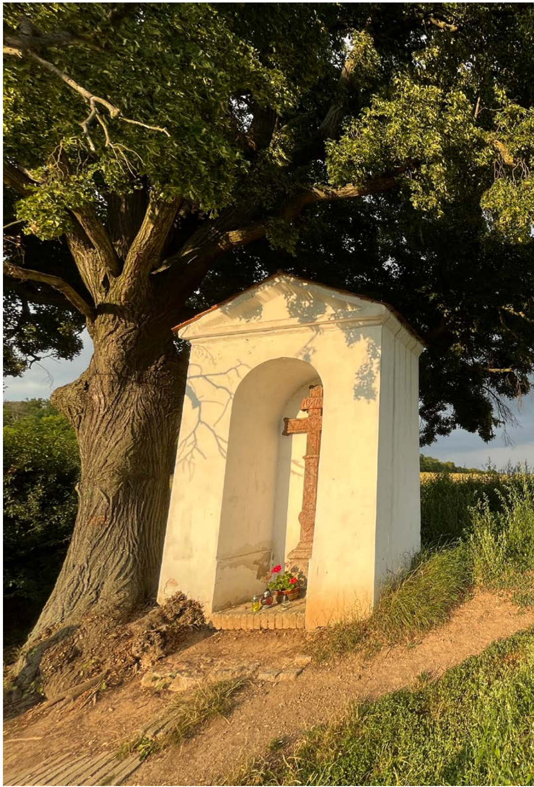
Foto: Výklenková kaplička