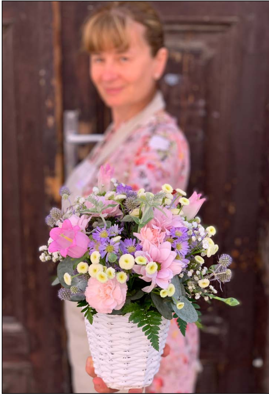
jarní věnec z Kytickárny