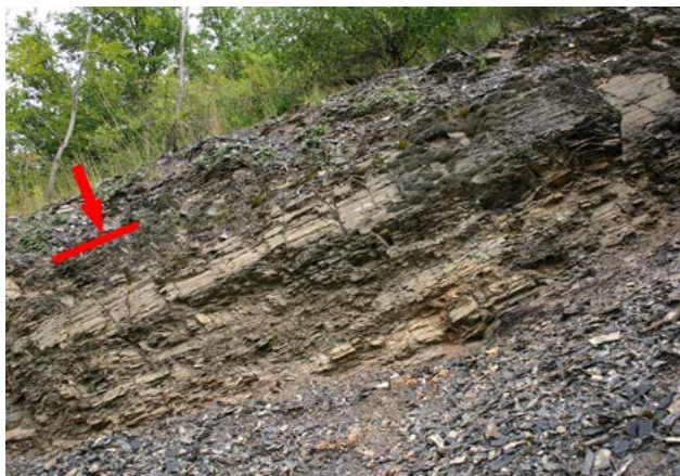
Spodní hranice stupně aeron na skále nad Třebaní

Vysoko na stráni na ně ostře nasedají černé břidlice želkovického souvrství, odpovídající stupňům rhuddan a aeron období spodního siluru. Hranice kosovského a želkovického souvrství přesně odpovídá úrovni hranice geologických útvarů ordovik a silur.