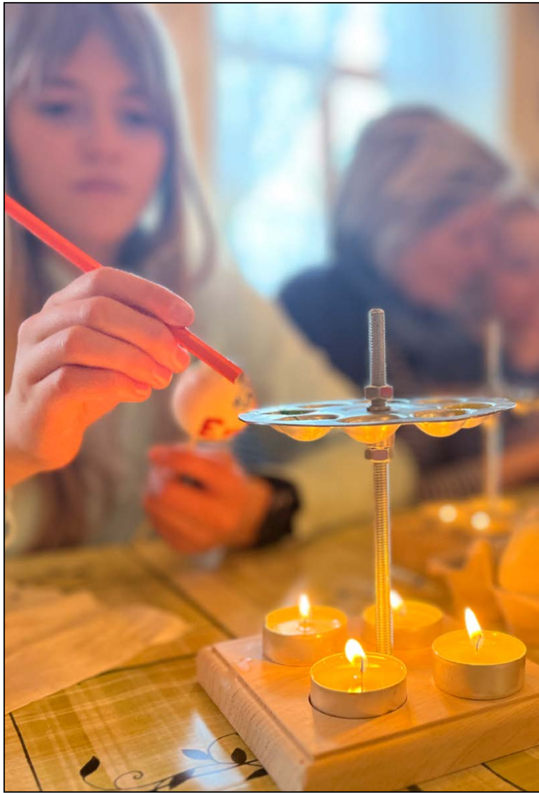
velikonoční tvoření