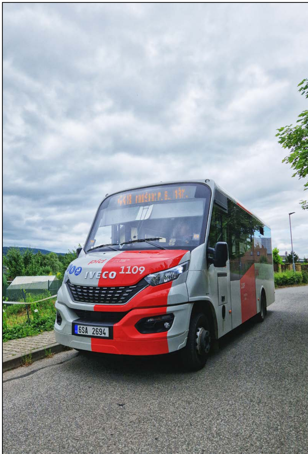
bus