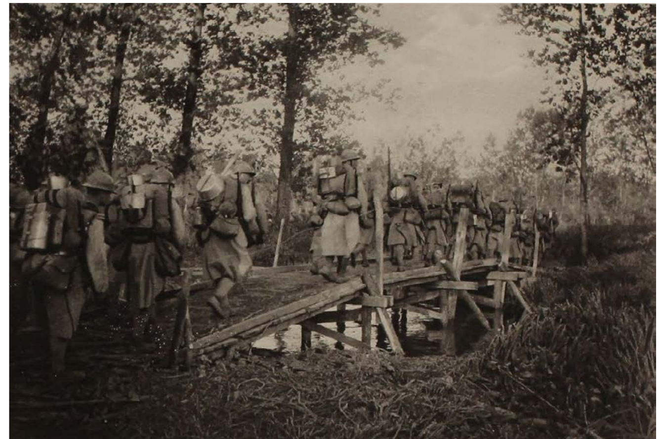
Legionáři před bitvou u Vouziers

Na srbské frontě Karel Spilka pravděpodobně dezertoval nebo byl zajat a dne 6. dubna 1918 se dobrovolně přihlásil k československým legiím. Dne 29. dubna 1918 dorazil do Francie, kde vstoupil jako střelec do 21. československého střeleckého pluku. O měsíc později, tedy dne 25. května, byl převelen k 22. československému střeleckému pluku. Tento tzv. argonský pluk vznikl v městečku Jarnac ze IV. praporu 21. čs. střeleckého pluku. Argonský pluk započal svou samostatnou činnost dne 20. května 1918 pod dočasným velením podplk. francouzské armády Armande Philippea. Skládal se z dobrovolníků, kteří přijeli z Ruska, Rumunska, Ame-