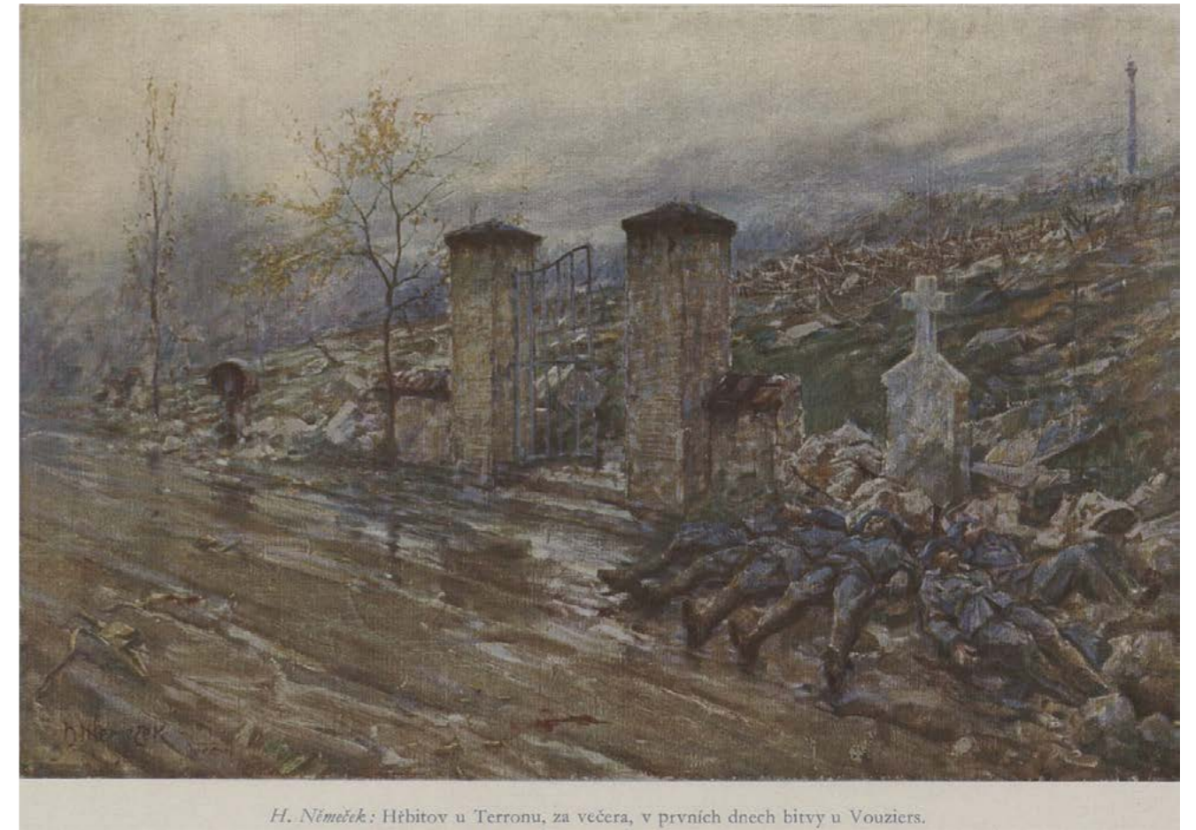
H. Němeček: Hřbitov u Terronu, za večera, v prvních dnech bitvy u Vouziers.