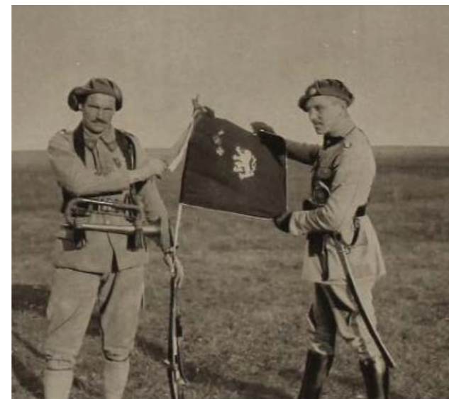
Vyznamenaný prapor 22. pluku

Na počest výše jmenovaných slova z druhého dílu knihy Československé legie ve Francii.