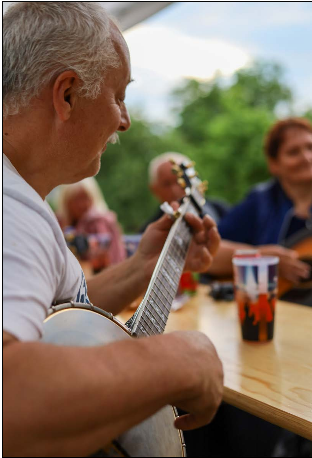
vítání léta 2020