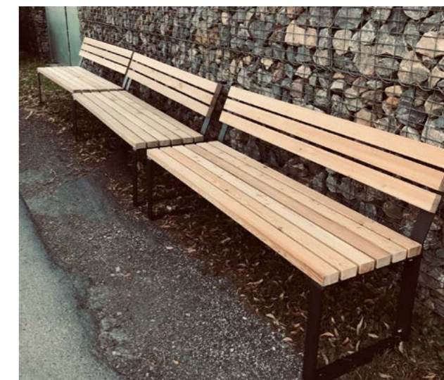
Tři lavičky, které čekají na své umístění